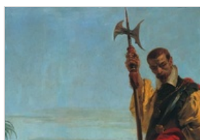
ALABARDIERE IN UN PAESAGGIO

GIAMBATTISTA TIEPOLO PINACOTECA GIOVANNI E MARELLA AGNELLI