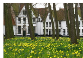
BEGHINAGGIO (BEGIJNHOF) BRUGES