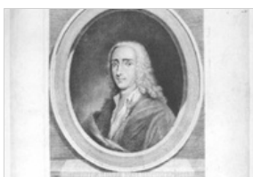
PIETRO ANTONIO FALCA (PIETRO LONGHI)