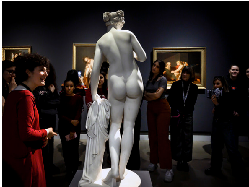
Isabella Balena, Bisogna essere nude per entrare nei musei?, Venere con la mela di B. Thorvaldsen 1816. Gallerie d'Italia, Milano, 2020