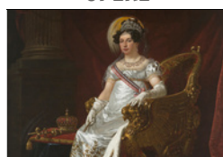
MARIA ISABELLA, INFANTA DI SPAGNA PIETER VAN HANSELAERE PINACOTECA