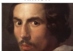
GIAN LORENZO BERNINI