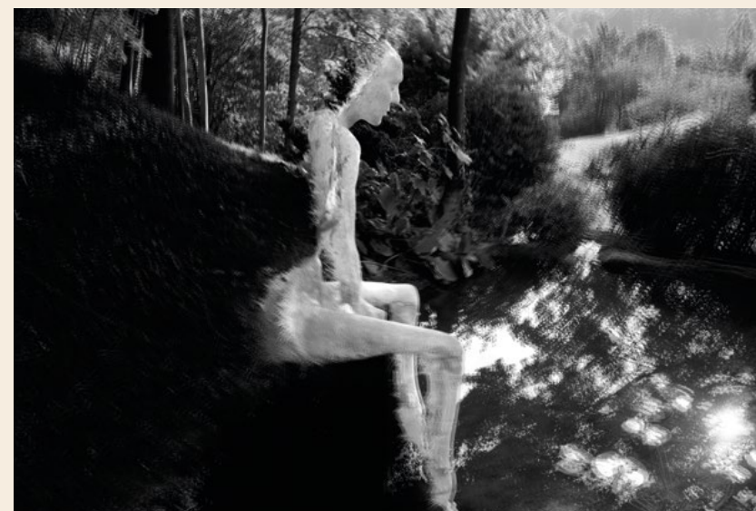
© Patrizia Riviera_Sculpite come le fratture nei boschi, dalla serie Sculpite

Credo che forse nelle donne ci sia più una coscienza collettiva e personale nell'affrontare le varie tematiche, nella scelta dei progetti.