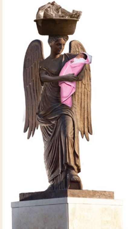
© Tiziana Arici_Mater Universalis, dalla serie Sculpite

Per capire lo spirito che anima l'Associazione abbiamo fatto un'indagine fra le socie chiedendo il motivo principale per cui hanno deciso di iscriversi.