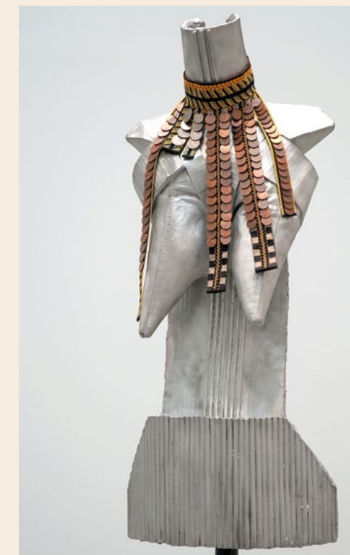
© Patrizia Pulga_La potenza delle donne, dalla serie Sculpite