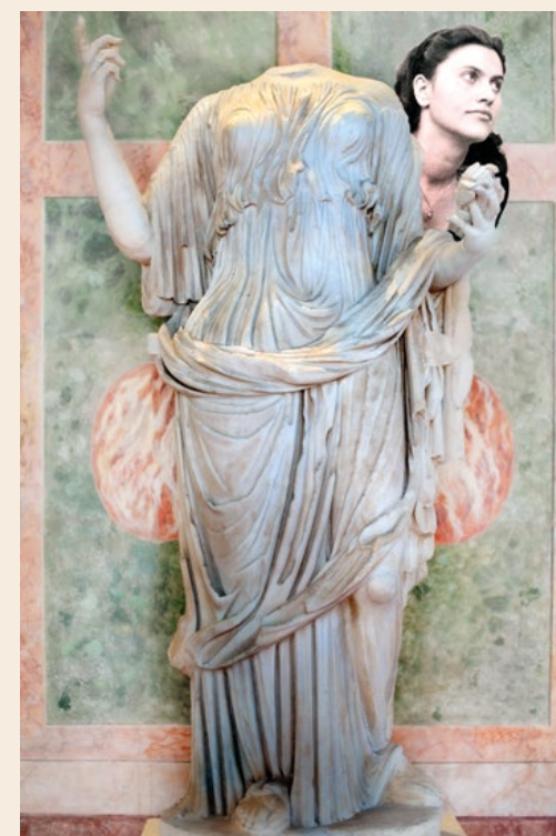
© Patrizia Bonanzinga_Sculpite nella storia, dalla serie Sculpite