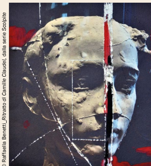
© Raffaella Benetti_Ritratto di Camille Claudel, dalla serie Sculpite