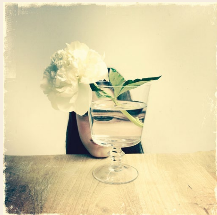
© Marzia Malli - Io ti guardo, tu mi vedi, dalla serie Invisibile