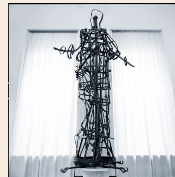
© Paola Mattioli_L'anima della Madonna, dalla serie Sculpite