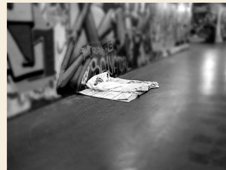
© Margherita Verdi_Le tracce degli invisibili_2019, dalla serie Invisibile