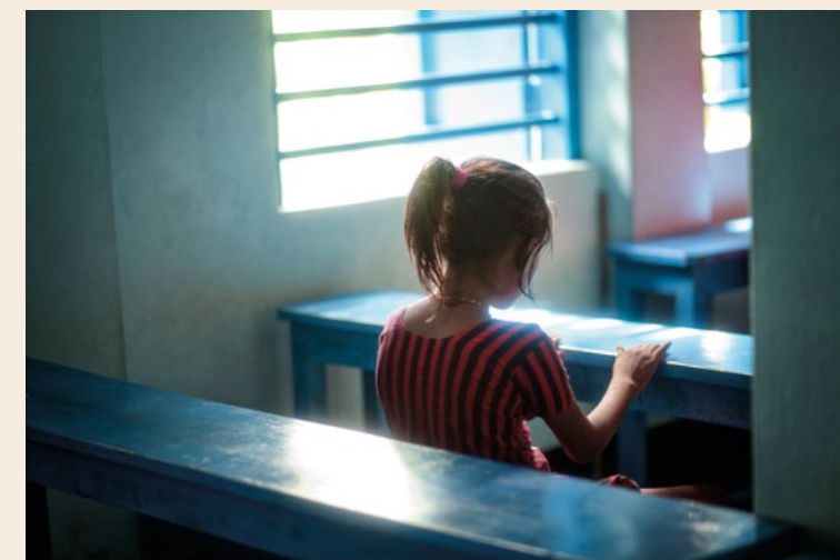
© Beatrice Mancini - Princess of Waterland, dalla serie Invisibile