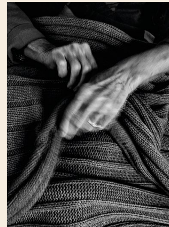
© Antonella Monzoni_Dimenticanza, dalla serie Invisibile

Tale tema è stato scelto per creare un'interazione con il quartie-