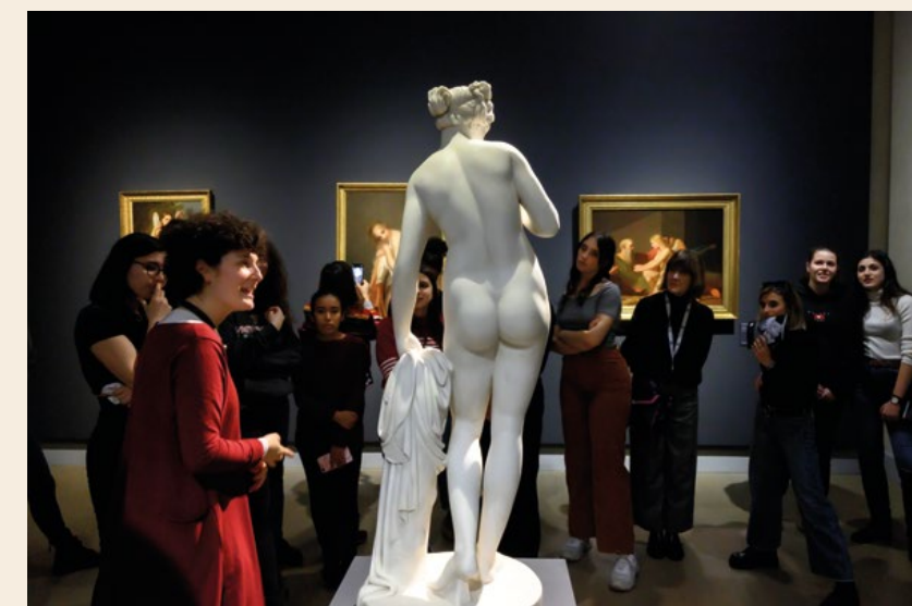
© Isabella Balena_Venere, dalla serie Sculpite