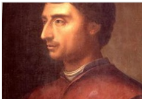
LEON BATTISTA ALBERTI (BATTISTA ALBERTI)