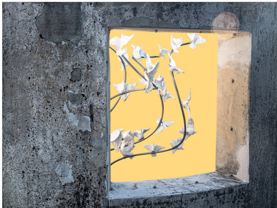
© Luisa Menazzi Moretti | Luisa Menazzi Moretti, Poesia, 2024