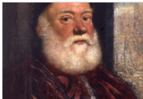
RITRATTO DI VECCHIO

JACOPO ROBUSTI (TINTORETTO) COLLEZIONI COMUNALI D'ARTE PALAZZO D'ACCURSIO O COMUNALE